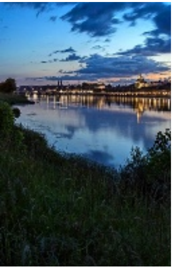
Chemin en bord de Loire vers le parc de la Creusille (Blois).