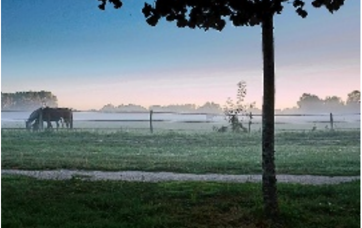
Un petit coin de campagne (Saint-Gervais).