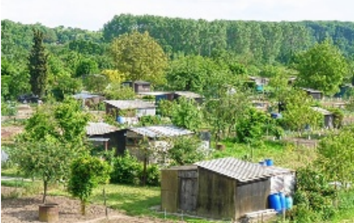
De la digue au parc des expos (Blois).