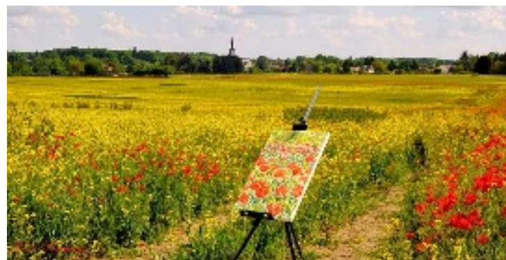
Près du cimetière (Cellettes).