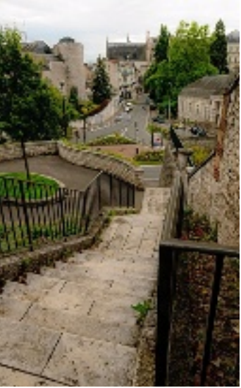
Rampe Chambourdin (Blois).