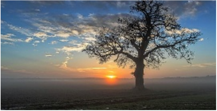
Un chêne vénérable route de Seillac (Onzain).