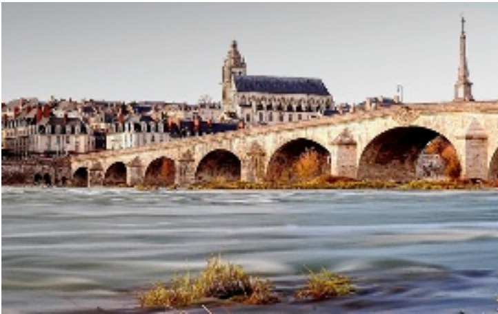
La Loire côté Vienne (Blois).