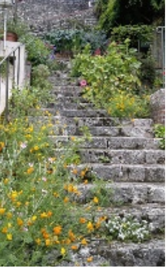
Rampe du Grain-d'Or (Blois).