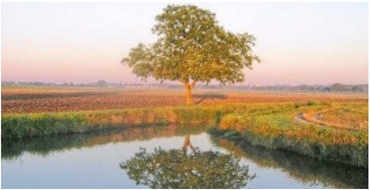
Promenade au Val des Noël's (Vineuil).