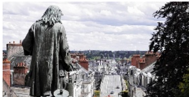
En haut de l'escalier Denis-Papin (Blois).

Dans cette catégorie, ce sont souvent des photos de lieux dégradés qui ont été envoyées, tels des endroits tagués, des décharges sauvages ou des friches industrielles. Les antennes ou le secteur de la Bouillie ont également été dans le collimateur des chasseurs d'images.