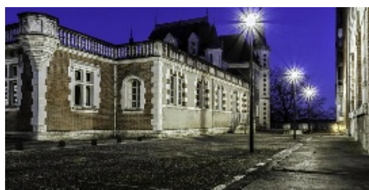
Rue de la Chocolaterie (Blois).