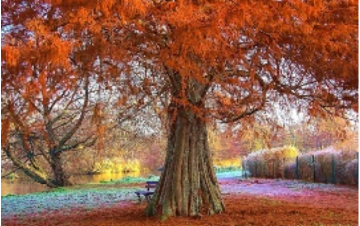
Là où j'aime me ressourcer (Cellettes).