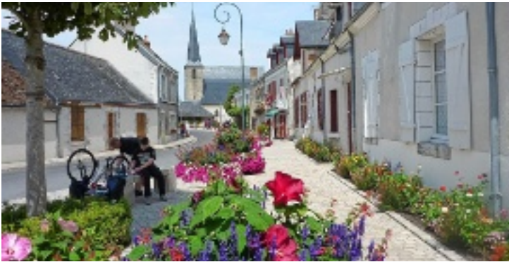
Avenue du Château (Cheverny).