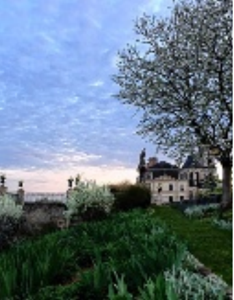
Parc de l'évêché (Blois).