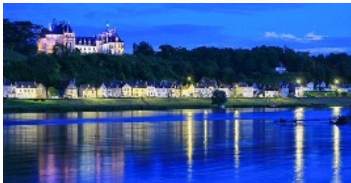
La Loire devant le château (Chaumont).