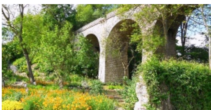
Sous le viaduc (La Chaussée-Saint-Victor).