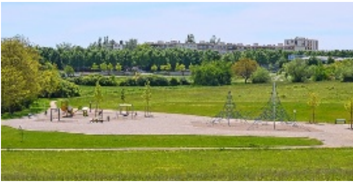
Sur un chemin pour aller à Quinière (Blois).