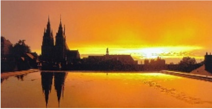
Rue du Foix (Blois).