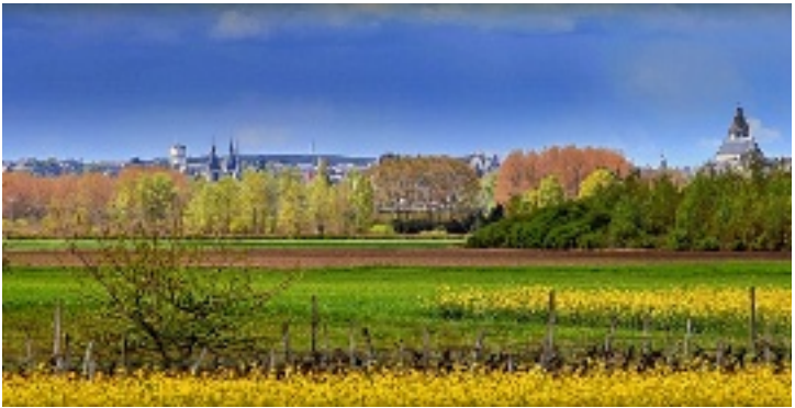
Balade aux Noël's (Vineuil).